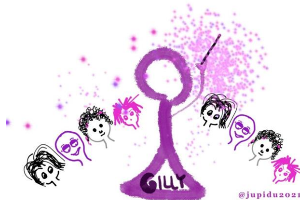
Grafik 3: Die Online-Sozialisierung nach Gilly Salmon

Die weiteren Episoden widmeten sich verschiedenen Aspekten des Online-Frauennetzwerks